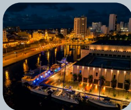
Turismo de negocios