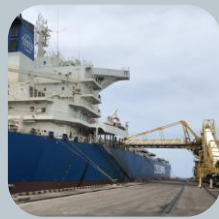
Minería y comercialización internacional