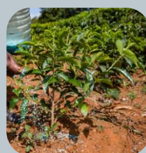
Fertilizantes y enmiendas