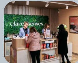
Belleza, cuidado personal y hogar