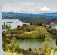
Turismo de aventura