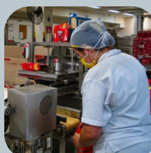
Logística y empaque